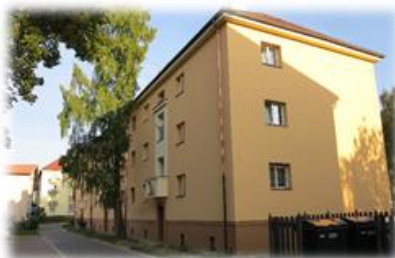
SVOBODY, PARDUBICE REALIZACE 2014 ZATEPLENÍ FASÁDY, PŮDY OPRAVA BALKÓNŮ FINANCOVÁNÍ - ČS, a.s.