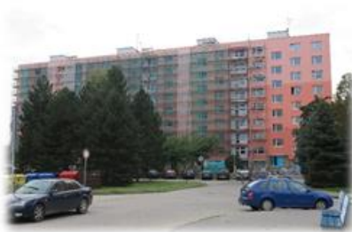
ZAHRADNÍ, SOBOTKA REALIZACE 2014 VÝMĚNA ROZVODŮ VODY FINANCOVÁNÍ – VLASTNÍ ZDROJE