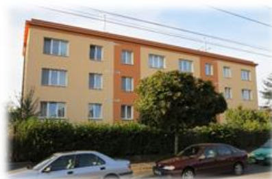
BUDOVCOVA, PODĚBRADY REALIZACE 2014 ZATEPLENÍ FASÁDY, STŘECHY A VÝMĚNA OTVOROVÝCH VÝPLNÍ FINANCOVÁNÍ - ČS, a.s.