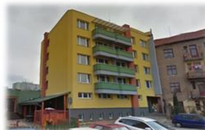
ANNENSKÁ, PARDUBICE REALIZACE 2013 ZATEPLENÍ FASÁDY, STŘECHY A VÝMĚNA OTVOROVÝCH VÝPLNÍ DOTACE – ZELENÁ ÚSPORÁM