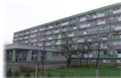
BROŽÍKOVA, HRADEC KRÁLOVÉ REALIZACE 2014 ZATEPLENÍ FASÁDY, STŘECHY, OPRAVA LODŽIÍ A VÝMĚNA OTVOROVÝCH VÝPLNÍ FINANCOVÁNÍ - ČS, a.s.