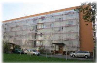
DRUŽSTEVNÍ, PARDUBICE REALIZACE 2014 ZATEPLENÍ FASÁDY, STŘECHY A VÝMĚNA OTVOROVÝCH VÝPLNÍ FINANCOVÁNÍ - ČS, a.s.